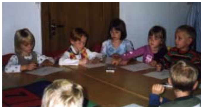
Söndagsskolan i Fjärestad samlade framför flanellografen.