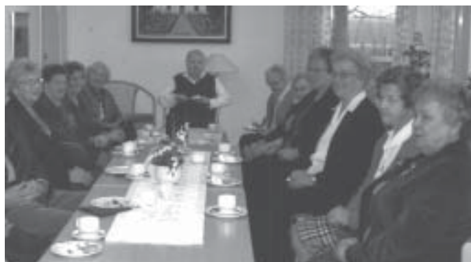
Syföreningen firade 75-årsjubileum i november 2003

På Kristi himmelfärdsdag 20 maj bjuder Kvistofta syförening på ottekaffe efter gudstjänsten kl 8.00.