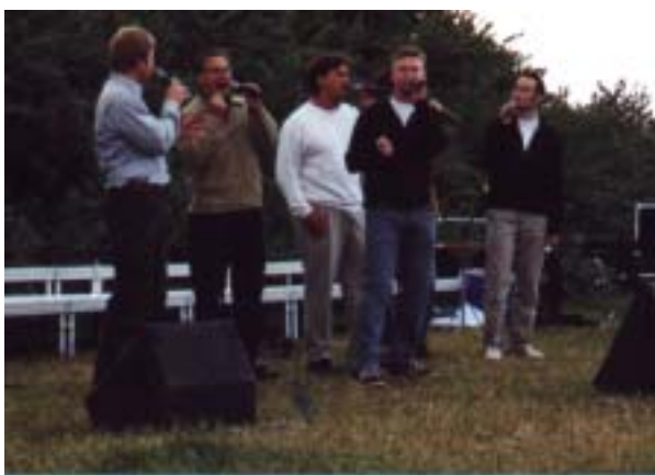
Konsert på Rydebäcksstranden förra gången det begav sig.

Jovisst blir det äntligen en strandkonsert igen. Det har nu gått några år sedan Kvistofta-Glumslövs kyrkokör senast hade en konsert på stranden men nu är det dags igen, och det klockan 17.00 på självaste 6 juni, Sveriges nationaldag. Självklart blir det mängder av "blåa toner" och musik som handlar om vatten, men även traditionell svensk musik måste ju sjungas denna nationaldag. Gästartister blir även denna gång gruppen Vocal Six från Malmö. 6 skönsjungande killar som garanterat får det att svänga. Glumslövs flickkör medverkar också. Alltså: Ta med picknickkorgen, filten, familjen, grannen, hunden och svärmor och njut av en härlig stund vid havet och den underbara Rydebäcksstranden.