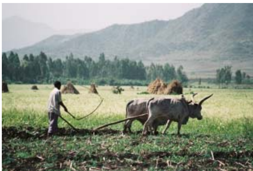
Awal på åkern med oxarna.

Att vara missionär är också att ge någon en framtidstro, att visa och våga se att vi är systrar och bröder och att det finns en djup samhörighet mellan oss även om vi inte tillhör samma kyrka, samfund eller kommer från samma land. På frågan om