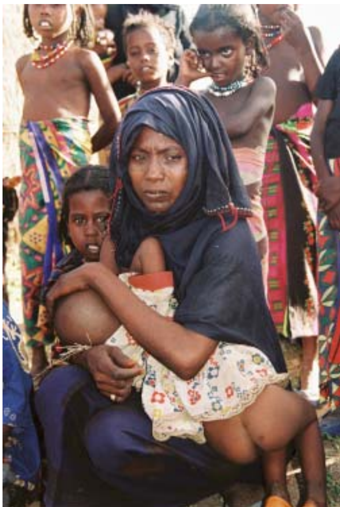
Hasena med ammande barn i knät

missionärerna och hjälparbetarna har någon betydelse i ett land som Etiopien är svaret enkelt. Hjälpen utifrån betyder ibland skillnaden mellan liv och död för landets invånare. För att de olika projekten ska bli till nytta för landet krävs ett samspel mellan befolkningen i landet och missionärerna. Därför är samarbetet med Mekane Yesus Church väldigt viktigt.