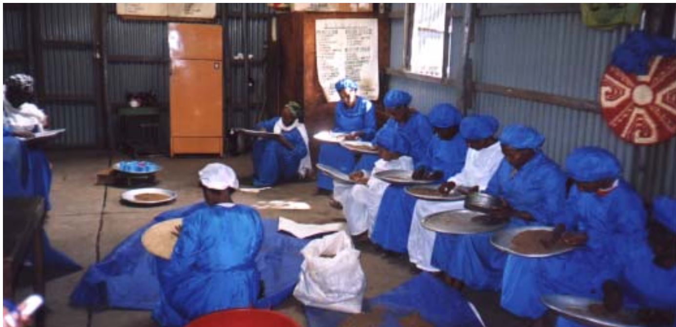
Kvinnorna i tvillingprojektet arbetar bland annat med kryddproduktion - här pågår sortering och rensning.